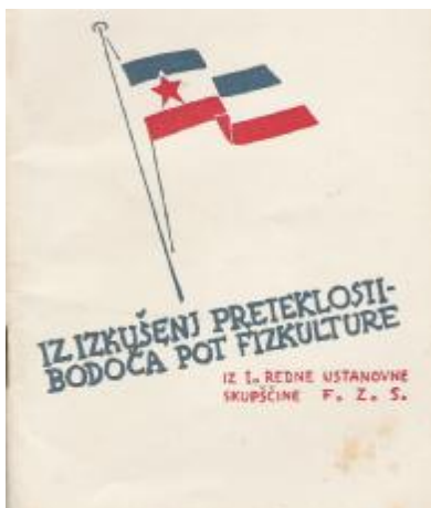
Začetki fizikulture v Sloveniji v letu 1945

Takoj po drugi svetovni vojni v letu 1945 se je bilo poleg obnove domovine potrebno nameniti skrb tudi narodovi zdravstveni obnovi, kjer pomaga predvsem organizirana telesna vzgoja. To je bilo poudarjeno tudi v dopisu o nujnosti telesne vzgoje, ki so ga predstavniki Slovenskega Primorja, odseka za prosveto oddelka za telesno vzgojo iz Ajdovščine 13.decembra 1945 naslovili vsem šolam, društvom in množičnim organizacijam v razpravo.