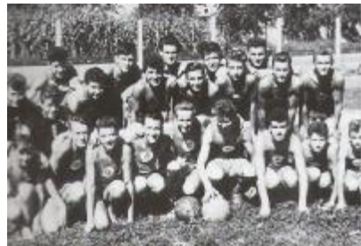
Košarkarji, ki so sodelovali v paradi športnikov za ob činski praznik 1954