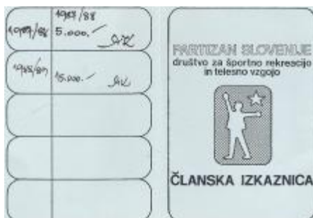
Enotna članska izkaznica tudi članov TVD Partizan Domžale