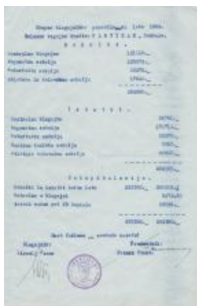
Skupno blagajniško poročilo društva za leto 1952

S temi prireditvami si je društvo pridobilo viden ugled, zlasti pa simpatije naše mladine, katere dotok v telovadnico se vedno večja. Tako je »Partizan« po številu članstva najmočnejše v Domžalah. V društvu se aktivno udelejuje 361 članov, od tega 223 moških in 138 žensk. Toda čeprav je število mladine v društvu v primerjavi z letom 1954 še enkrat večje, je mladine še vedno odločno premalo. Zaradi tega so na zboru sklenili, da bodo v svoje vrste pritegnili še več mladih ljudi. Uspehi društva pa bi bili nedvomno še večji, če ne bi imelo društvo težav zaradi pomanjkanja prostorov. Društvo nima niti lastne telovadnice, temveč gostuje v gimnaziji. Ta edina telovadnica pa ne more sprejeti vseh tistih, ki želijo telovaditi ali se športno udeleževati. Društvo si želi zgraditi lastni dom, ali pa vsaj primerno telovadnico in druge potrebne prostore, prav tako pa si nabaviti vsaj najnujnejše rekvizite.