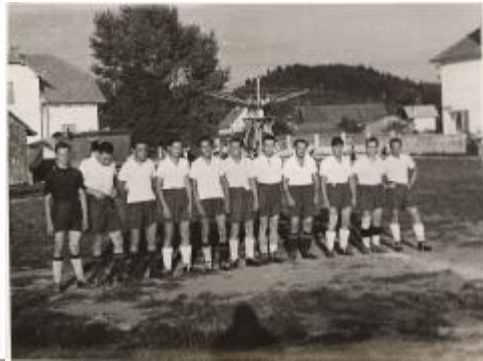
Nogometna tekma v Domžalah 1946