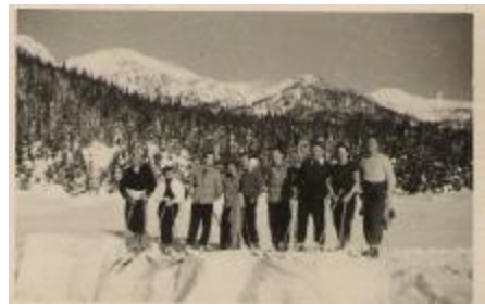
Smučarski tečaj Partizana Domžale 1951 pri Domžalah in 1952 na Veliki planini

Iz poročil, ki so jih na občnem zboru koncem leta 1955 podali predsednik, tajnik, na čelnik in ostali, je razvidno, da je bilo društvo v minulemu letu precej delavno: