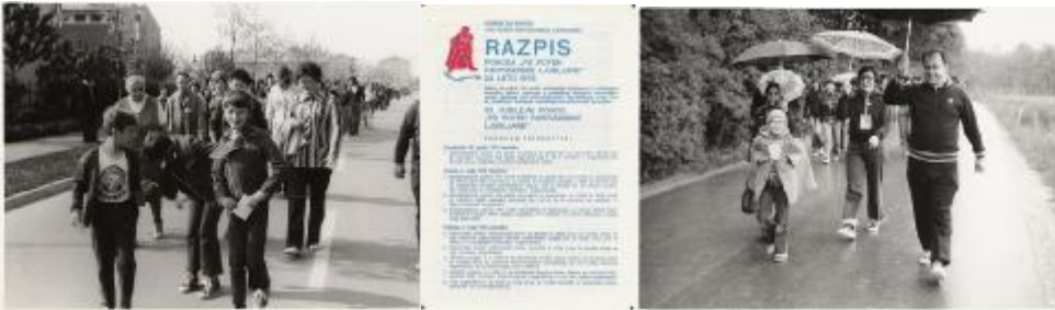
Pohod okoli Ljubljane 1974