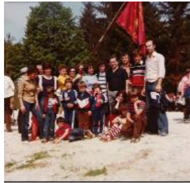
Občinska proslava na Oklem 1980

V društvu PARTIZAN je bilo v letu 1982 – 1983 članjenih veliko rekreativcev, vse od najmlajših do najstarejših. Posebno je razveseljivo veliko zanimanje za rekreacijsko vadbo med našimi najmlajšimi udeleženci-cicibani, kjer se vsako leto k vadbi prijavi do 80 predšolskih otrok, ki jih vodijo štiri vaditeljice.