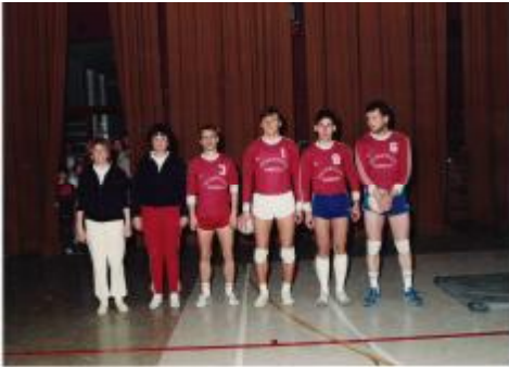
Sekcija tekmovalno-rekreacijske skupine odbojke, ki je nastopala v rekreacijski ligi