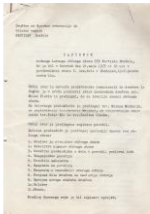
Zapisnik z občnega zbora 1973, važen dokument pri reorganizaciji TVD Partizan Domžale

Ugotovitev, da društvo že več kot 5 let ni imelo občnega zbora kaže na to, da so bile navedene slabosti resnično take, da jih je treba odpraviti, temu pa naj služi razprava na današnjem občnem zboru, ki naj da društvu dela voljan in ambiciozen upravni odbor ter številčno dovolj močan tehnični odbor. Želja vseh sedanjih in nekdanjih športnikov je, da bi domžalski Partizan spet postal matično društvo za telesno kulturo v občinskem merilu, da bi nekaj pomenil tudi izven občinskih meja. Zato izrazim željo, naj bi funkcije v pooživljenem društvu prevzeli ljudje, ki bodo sposobni te cilje tudi realizirati.«