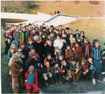
Pred spomenikom v Dražgošah 1980

organizirana vadba, šlo je za šolsko leto 1982 – 1983 in sicer z istim urnikom kot je veljal v preteklem letu po ustaljenih skupinah.