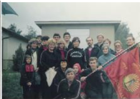
Ob društvenem praporju v letu 1986

»Čeprav imajo člani društva TVD Partizan na čelno zagotovljeno vadbo v Hali KC, se je večkrat v lanski in letošnji sezoni zgodilo, da je prišlo do sprememb dodelitve dvorane posameznim uporabnikom. Na naš predlog o pogodbenem razmerju s točno določenimi fiksnimi roki smo dobili odklonilno stališče. Takšnega ravnanja ne moremo ne razumeti ne sprejeti. Če TVD Partizan Domžale pravočasno in na pravi način poda svoje potrebe po dvorani, potem naj to velja tudi za vse ostale kandidate pri uporabi dvorane. Moramo povedati, da takšno ravnanje povzroča hudo ogorčenje med našimi člani. Nekateri so zaradi tega izgubili voljo in ne hodijo več k odbojki.«