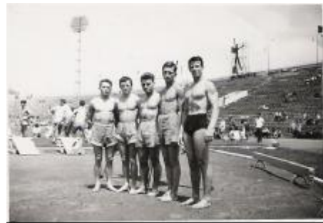
Članska vrsta TVD Partizan Domžale 1959 na DP v Beogradu

V poročilu Občinske zveze za telesno kulturo Domžale so za sezono 1961/62 zapisali: »Na teritoriju občine Domžale deluje 15 osnovnih organizacij in sicer 8 partizanskih društev, 1 taborniško organizacijo, 5 samostojnih klubov ter 1 šolsko športno društvo. Eno od partizanskih društev je tudi TVD Partizan Domžale. Ugotavlja se še, da se aktivno ukvarja s temeljno telesno vzgojo okoli 65% članstva. Vzroke temu je treba iskati, da se vse premalo vodijo računa vodstva osnovnih organizacij, ki bi morala usmerjati mladino v množično tekmovanje. Po drugi strani pa lahko nenehno iščemo vzroke pomanjkanja telovadišč, igrišč ter ostalih športnih objektov, saj nima vseh 15 osnovnih organizacij niti ene lastne telovadnice. Poedine organizacije se poslužujejo le občasnih gostovanj v domovih, kjer uporabljajo predvsem odre prosvetnih ali zadružnih domov. S tako nenačrtovano temeljno telesno vzgojo pa ni misliti razvojno pot boljše perspektivne telesne vzgoje.«