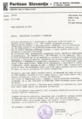
Društvo je bilo leta 1989 soorganizator akcije Partizana Slovenije »Razgibajmo življenje«