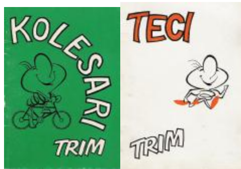
Dve veliki akciji koncem 70-let

Po ponovnem začetku dela v TVD Partizan Domžale so sprejeli tudi odločitev, da je nujno potrebno oživiti delo društva še s pridobivanjem novega članstva. Predvsem je bilo potrebno nanovo postaviti temelje društva, nadzirati delovanje vadbenih skupin s pridobivanjem novih članov, urediti poslovanje društva in izdelati jasen program dela za posamezne sekcije. Prednostno naj bi omenjene aktivnosti opravljali na rekreacijske ravni, če bi se pokazala potreba pa tudi na tekmovalni ravni. Društvo je delalo predvsem na poudarjeni vadbi s cicibani in cicibankami, pionirji in pionirkami ter nasploh z mladino. Sploh je postala rekreacija vse bolj vrednotena kot družbena potreba, kar dokazuje tudi posebej številčen obisk žensk na vadbenih urah. Z obuditvijo društva se je tudi nadaljevala organizirana vadba.