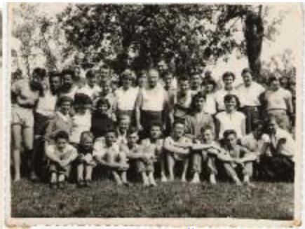
Republiški nastop v Črnomlju 1956