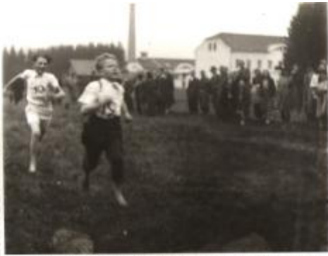
Pomladni kros, borba mladine pred ciljem