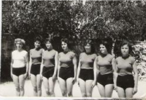
Članice TVD Partizan Domžale 1959

vedno še z večjo vnemo nadomestile morebitno odstopno prijateljico na tekmovanjih. Lahko rečemo, da so tekmoval predvsem s srcem, za čast in z ljubeznijo do športa.