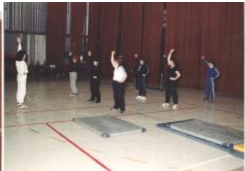
Članice društva v igrah z žogo in na rekreativni vadbi telovadbe

V ponudbi vadbe smo se v društvu ozirali tudi drugam. Posebej zanimiva, po svoje pa tudi atraktivna, pa je bila odločitev, da se telovadno društvo loti tudi športnih disciplin za močnejše športnike. Tako je bil spomladi 1987 organizirano s strani društva – občinsko prvenstvo v body-buildingu. Posebej sta bili ocenjevani dve disciplini in sicer moč (vlečenje ročke-uteži od tal, dvigovanje uteži iz počepa, potisk na klopi »benč«) in telesna oblikovanost tekmovalcev.