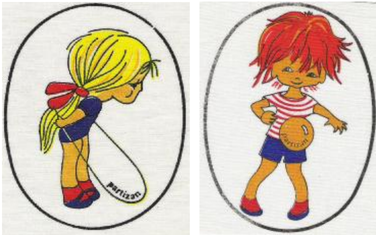
Znaki pionirke in pionirja, ki so jih dobili najprizadevnejši mladi člani društva

V adbeno sezono 1983/84 smo zaključili 16.junija 1984. Za sklep sezone vadbe v zaprtih prostorih smo organizirali športno rekreativni piknik v naravi pod Dobenom. Na tej prireditvi smo organizirali športna tekmovanja za vse starostne skupine : skok v višino, skok v daljino z mesta, tek na 100 m, ter igre z žogo ( odbojko, med dvema ognjema in nogomet). Zaključne prireditve se je udeležilo približno 60 članov društva.