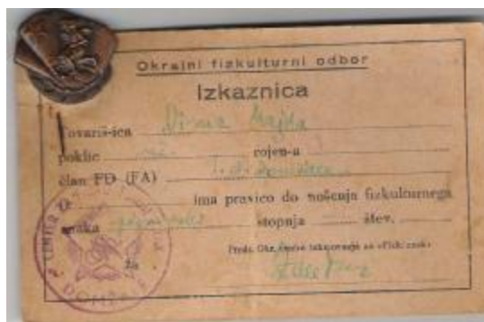
Pionirska izkaznica okrajnega fizkulturnega odbora Domžale leta 1946