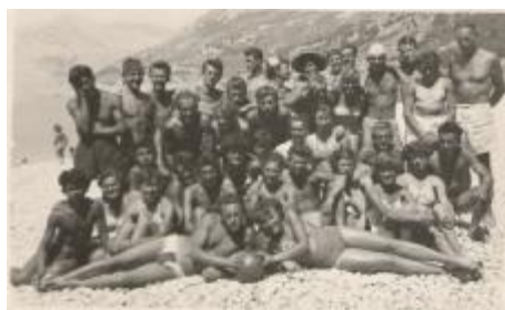
Telovadni tečaj v Makarski 1954

S temi prireditvami si je društvo pridobilo viden ugled, zlasti pa simpatije naše mladine, katere dotok v telovadnico se vedno večja. Tako je »Partizan« po številu članstva najmočnejše v Domžalah. V društvu se aktivno udelejuje 361 članov, od tega 223 moških in 138 žensk. Toda čeprav je število mladine v društvu v primerjavi z letom 1954 še enkrat večje, je mladine še vedno odločno premalo. Zaradi tega so na zboru sklenili, da bodo v svoje vrste pritegnili še več mladih ljudi. Uspehi društva pa bi bili nedvomno še večji, če ne bi imelo društvo težav zaradi pomanjkanja prostorov. Društvo nima niti lastne telovadnice, temveč gostuje v gimnaziji. Ta edina telovadnica pa ne more sprejeti vseh tistih, ki želijo telovaditi ali se športno udeleževati. Društvo si želi zgraditi lastni dom, ali pa vsaj primerno telovadnico in druge potrebne prostore, prav tako pa si nabaviti vsaj najnujnejše rekvizite.