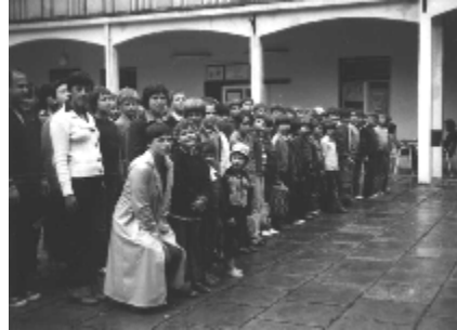
S tekmovanja v Izlakah leta 1978

V letu 1977 so bila sprejeta Pravila TVD Partizan Domžale. Že v naslovu je zapisano, da je to društvo za športno rekreacijo in telesno vzgojo, da gre za prostovoljno združenje občanov za uresničevanje športne rekreativne dejavnosti in telesne vzgoje. Prav tako pa je bilo s samoupravnim sporazumom društvo TVD Partizan Domžale določeno kot soustanovitelj, bilo je član Občinske zveze telesnokulturnih organizacij Domžale, Partizana Slovenije, Zveze za športno rekreacijo in telesno vzgojo.