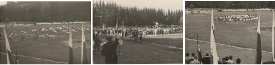
Telovadni nastop 1950 leta v Jaršah, zbrale so se vse starostne skupine Partizan Domžale