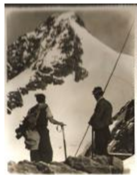
Domžalčani na Velikem Kleku leta 1946