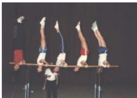
Telovadna vrsta društva na nastopu na bradlji leta 1987

Na občnem zboru v aprilu 1988 je predsednik Omahna potrdil uspešnost vadbe, pri čemer je cilj društva predvsem rekreacija, čeprav se pri mladih čuti težnjo po tekmovanju in prikazu svojega znanja. Še posebej pa so pohvalili prikaz dela društva, ki je bil organiziran 11.aprila v Hali Komunalnega centra v Domžalah. Na volitvah organov društva so bili v organe upravljanja društva izvoljeni naslednji člani: