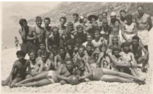
Telovadni tečaj v Makarski 1954

Ker se je ekipa članov takrat nekako že poslavljala, so veliko upov polagali v uspeh mladincev. In ne zaman! Po intenzivnih vadbenih urah in uspešnih nastopih so v naslednjih letih dobesedno eksplodirali.