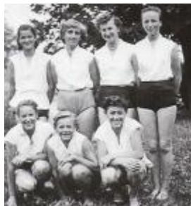
Ženska košarkarska ekipa TVD Partizan Domžale iz leta 1953