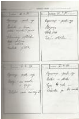
Iz dnevnika telovadnega učitelja