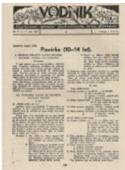
Vodnik-strokovno glasilo fizkulture zveze Slovenije v letu 1947