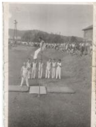
Tekmovanje 1955 v Medvodah