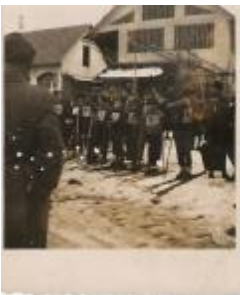
Tekmovanje v smučarskem teku-pionirji 1946 organizirano pred »Ivotom« po Šumberkom