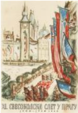
Veliki vsesokolski zlet v Pragi 1948