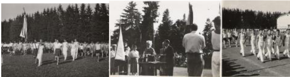
Razvitje prapora v Domžalah 1954