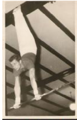
Trening na gimnazijskem dvorišču Domžalah 1963 in na treningu v dvorani

Kot je videti, je bilo obdobje po letu 1965 pa vse do leta 1973 najmanj plodno v vsej zgodovini TVD Partizan Domžale. Naši viri govorijo, da je bilo do leta 1965 še čutiti nekakšno organizacijsko prevlado TVD Partizana Domžale, nato pa so ostala partizanska društva v takratni občini Domžale (Dob, Radomlje, Ihan, Jarše, Mengeš, Lukovica, Moravče) prevzela vodilno vlogo tako v organizacijskem smislu kot tudi pri organizirani vadbi. Glavne sekcije TVD Partizan Domžale so bile v tistem obdobju tele: telovadna, smučarska, odbojkerska in planinska. Kot je razvidno že iz poročila, so bili glavni problemi v financiranju dejavnosti.