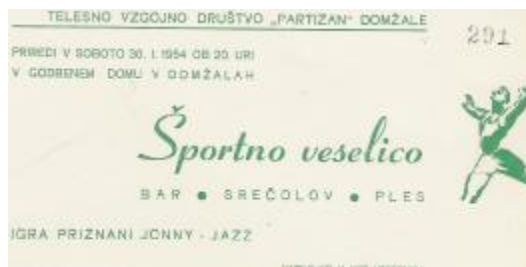
Veselica TVD Partizan Domžale 1954 leta

Društvo je organiziralo tudi veselico, ki so jo sami financirali, sposodili so si gramofon, gramofonske plošče, zabava je bila pomemben družabni dogodek, pri katerem so pomagali vsi člani društva.