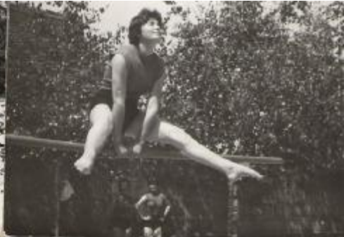
Ani na bradlji