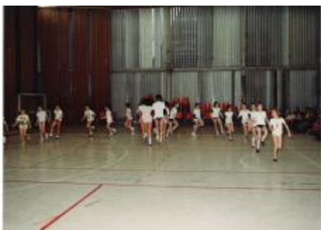
Najmlajši med nastopom prikaza dejavnosti društva v hali KC v Domžalah 1987