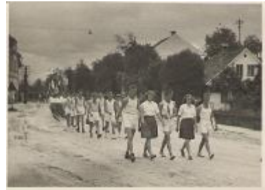
Povorka v Domžalah leta 1950