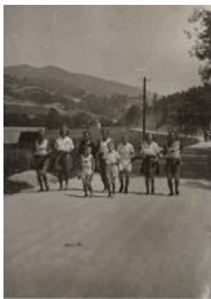
Štafeta mladosti-Titova štafeta 1946 v Domžalah