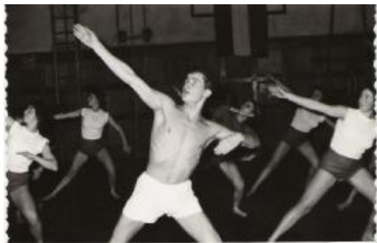
»Turški marš«-ena najtežjih skupinskih vaj