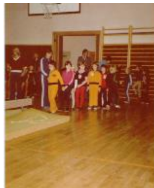
V 80-letih iz telovadnice ob vadbi pionirk in pionirjev