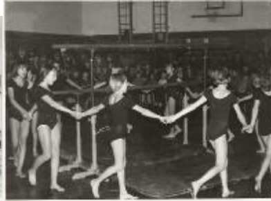
Telovadna akademija vseh kategorij 1954

Ker se je ekipa članov takrat nekako že poslavljala, so veliko upov polagali v uspeh mladincev. In ne zaman! Po intenzivnih vadbenih urah in uspešnih nastopih so v naslednjih letih dobesedno eksplodirali.