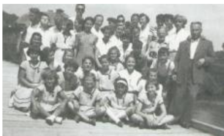
Telovadni nastop 1953 v Medvodah