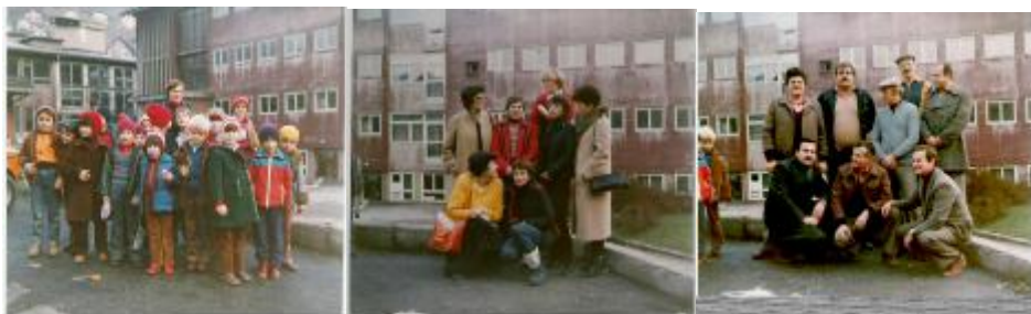
Obisk pri TVD Partizan Jesenice v letu 1980

V letih 1980 in 1981 je bilo zabeleženo zelo intenzivno sodelovanje s telovadnim društvom Partizan Jesenice, h kateremu so se člani našega društva odpravili leta 1980. V naslednjem letu 31.maja 1981 so se člani TVD Partizan Jesenice in TVD Partizan Domžale ponovno zbrali na tovariškem srečanju in sicer v sklopu prireditev v počastitev praznika Občine Domžale. Tekmovanja in srečanje so potekali na športnem igrišču ob osnovni šoli »Šlandrove brigade« v Domžalah.