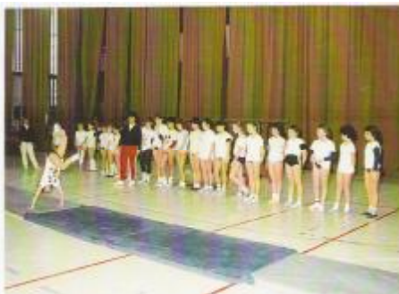
Nastop v Hali Komunalnega centra 1987