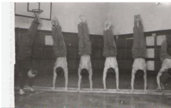
Vrsta mladincev-stoja na lestvi 1956 v telovadnici Jarše

Zadnja skupna uspešna leta članov te generacije so bila v letih 1960-61, ko se zgodi vrsta meddruštvenih in medklubskih dvobojev, predvsem je vsem v spominu ostalo rivalstvo z Zagorjem, ko se kar nekajkrat pomerijo članske ekipe 1.razreda. Aktivnosti in povratni dvboj se nadaljujejo tako v telovadnicah kot na zunanjih telovadiščih.