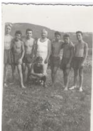
Nastop v Moravčah 1954