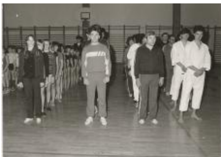
Akademija vseh vadbenih skupin 1984